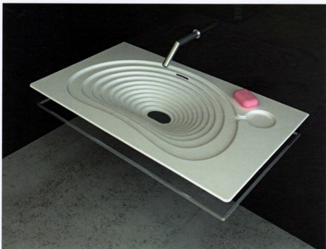
Ondřej Václavík: umyvadlo H2O